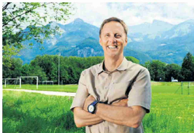
Le plongeur canadien partage son temps entre la conservation océanographique et les compétitions d'apnée.

«L'homme au service de la montagne» est le thème retenu pour l'édition 2012. Mais on n'y parlera pas que des sommets